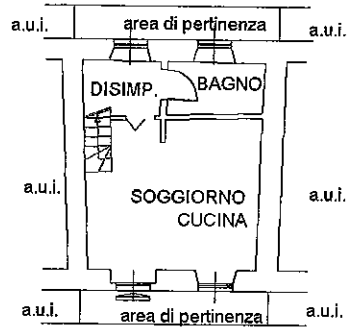
PIANO TERRA H.ML. 3.20